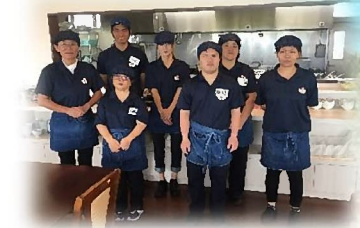
レストラン太平山のみなさん