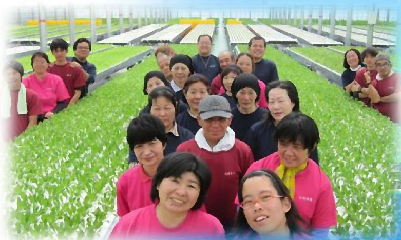
野菜ランドみやこのみなさん