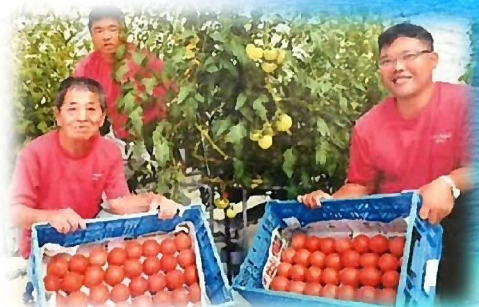
トマトランドみやこのみなさん