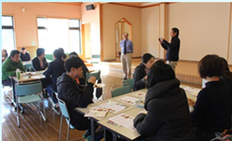
体験ツアー中の座談会