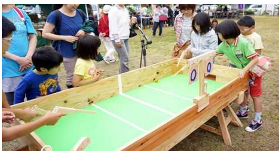
熱戦!!輪ゴムdeサッカー