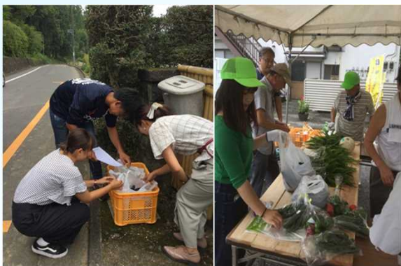
大学生による農産物の輸送支援