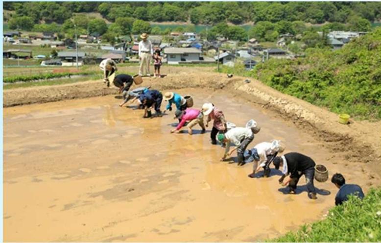
耕作放棄地を再生した田んぼで、地域住民と田植え