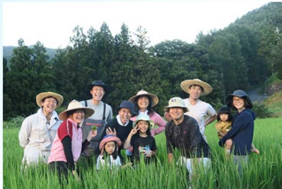
地元住民の正社員化など雇用の創出