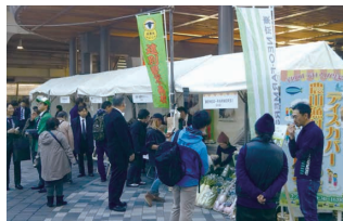
東京の有楽町におけるマルシェ（令和元年12月）

「ディスカバー農山漁村の宝」に選定された地区に対しては、農林水産省ホームページ等で活動を紹介するほか、様々なイベントへの出展支援を通じて、全国的な情報発信を行っています。