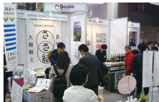
アグリフード EXPO 大阪（令和2年2月）