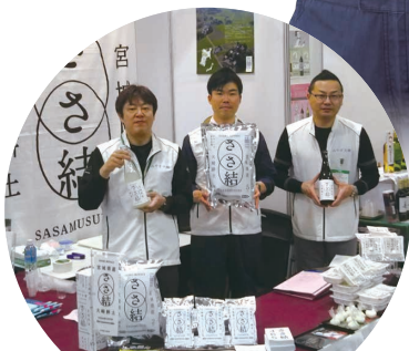
大崎の米「ささ結」ブランドコンソーシアム (宮城県大崎市) (第5回選定地区)