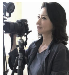
織作 峰子 大阪芸術大学教授 写真家