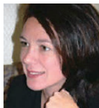
あんまくと なるど 上智大学大学院教授 慶応義塾大学特任教授