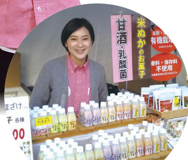
高千穂ムラたび協議会 (宮崎県高千穂町) (第3回選定地区)