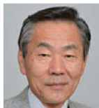
林 良博 国立科学博物館館長