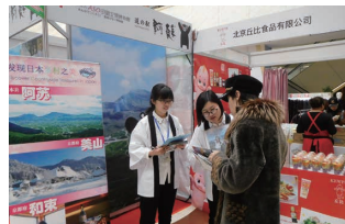
大連ジャパンブランド<中国大連市>（平成30年3月）